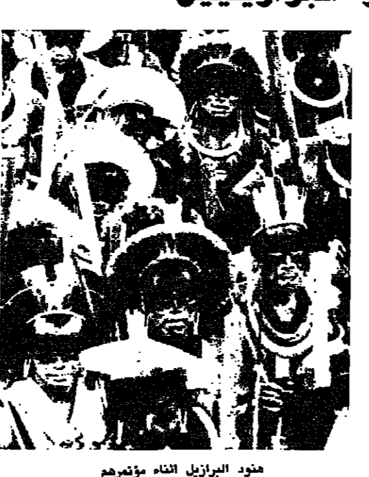
هنود البرازيل أثناء مؤتمرهم